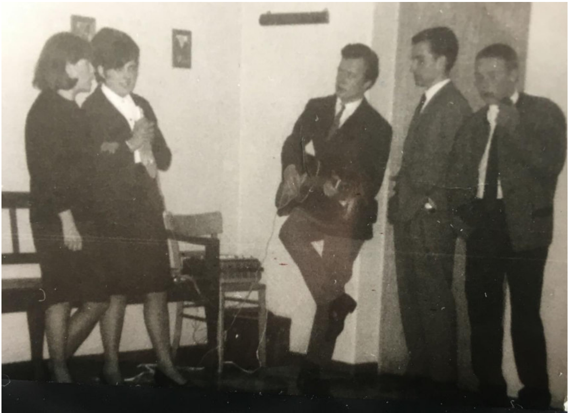
Jugendarbeit im Jugendheim