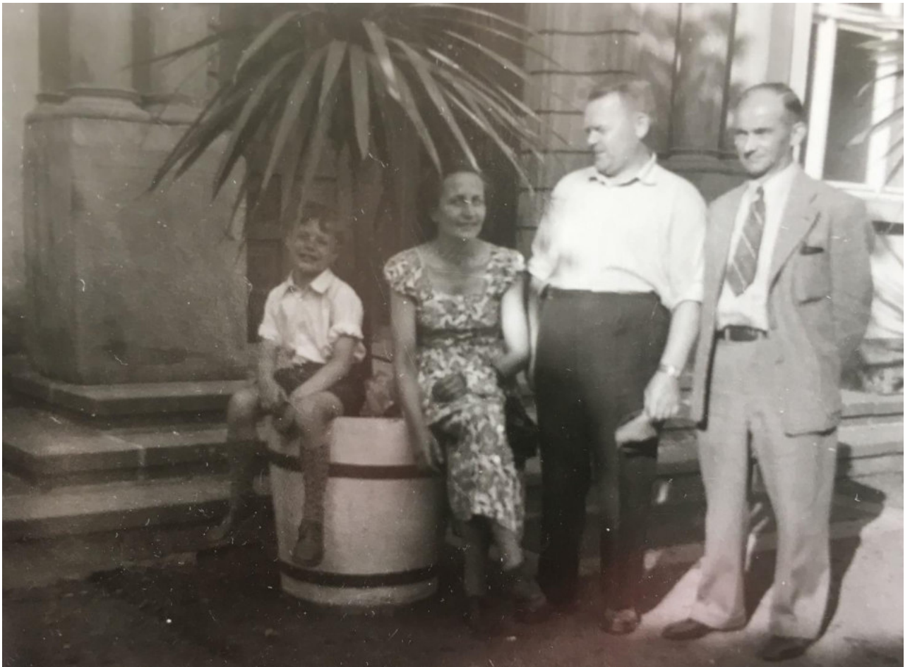
Im Kurhaus von Bad Salzig