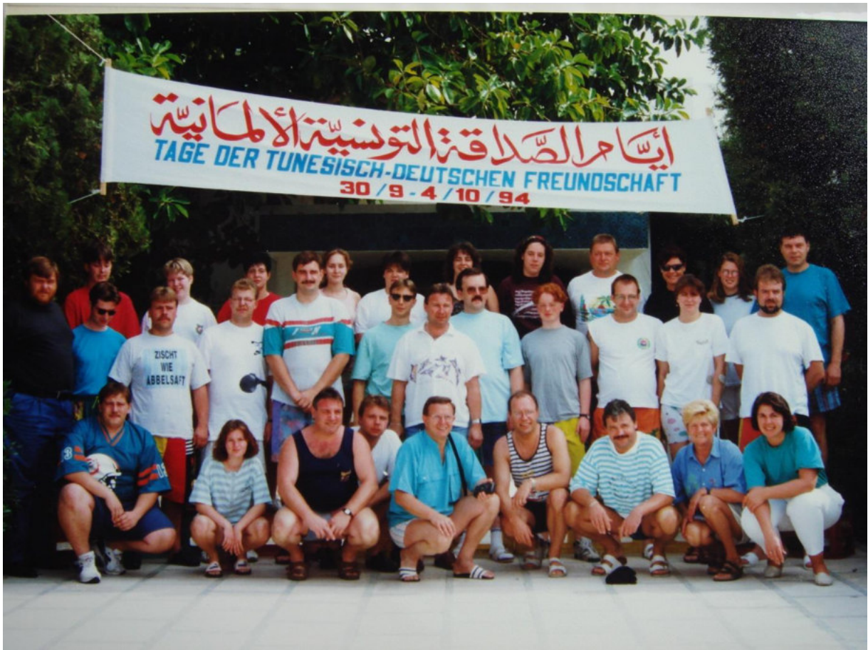
2 mal mit dem Musikverein In Tunesien