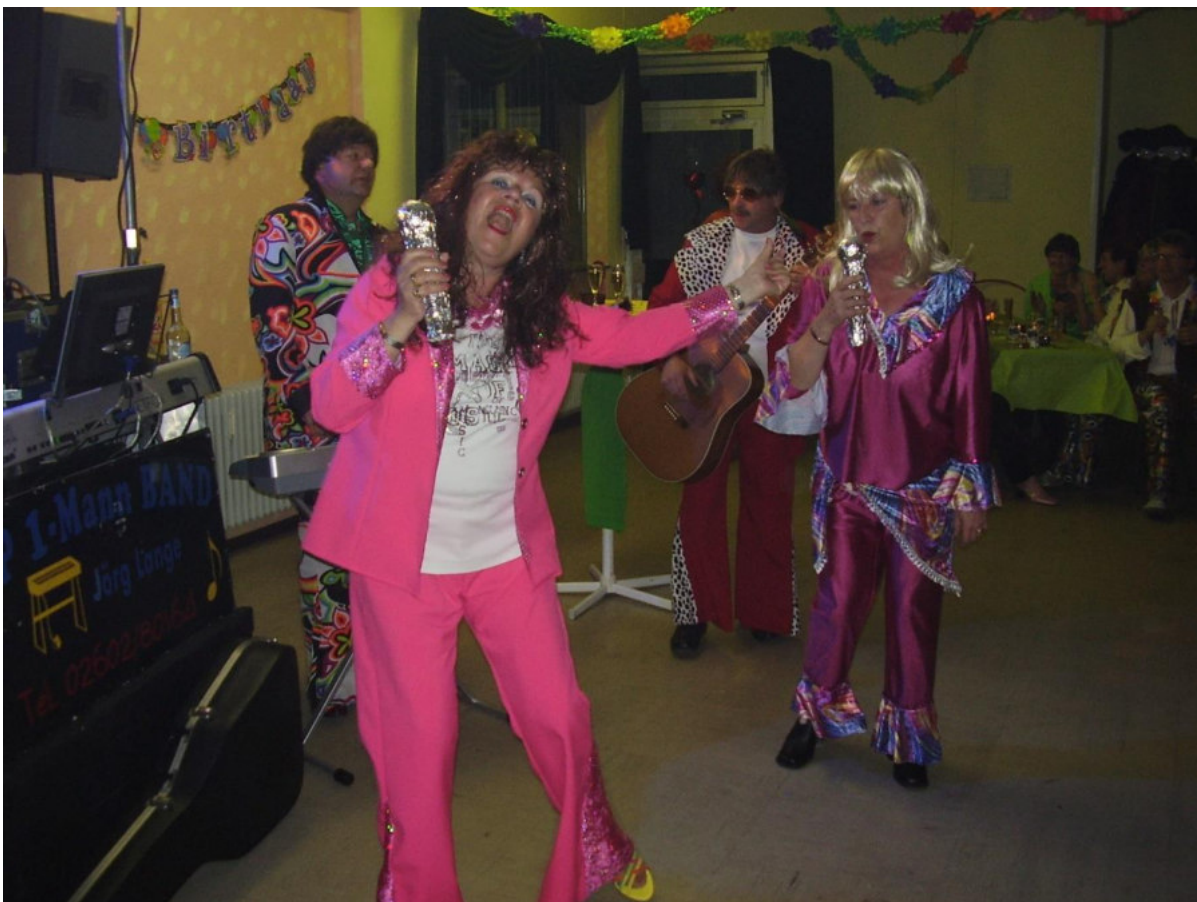
ABBA im Westerwld