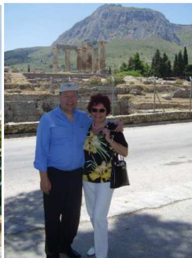
Essen im Korinth Gr