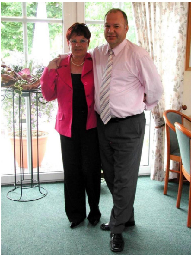
Hochzeit von Franko Wilhelmhaven