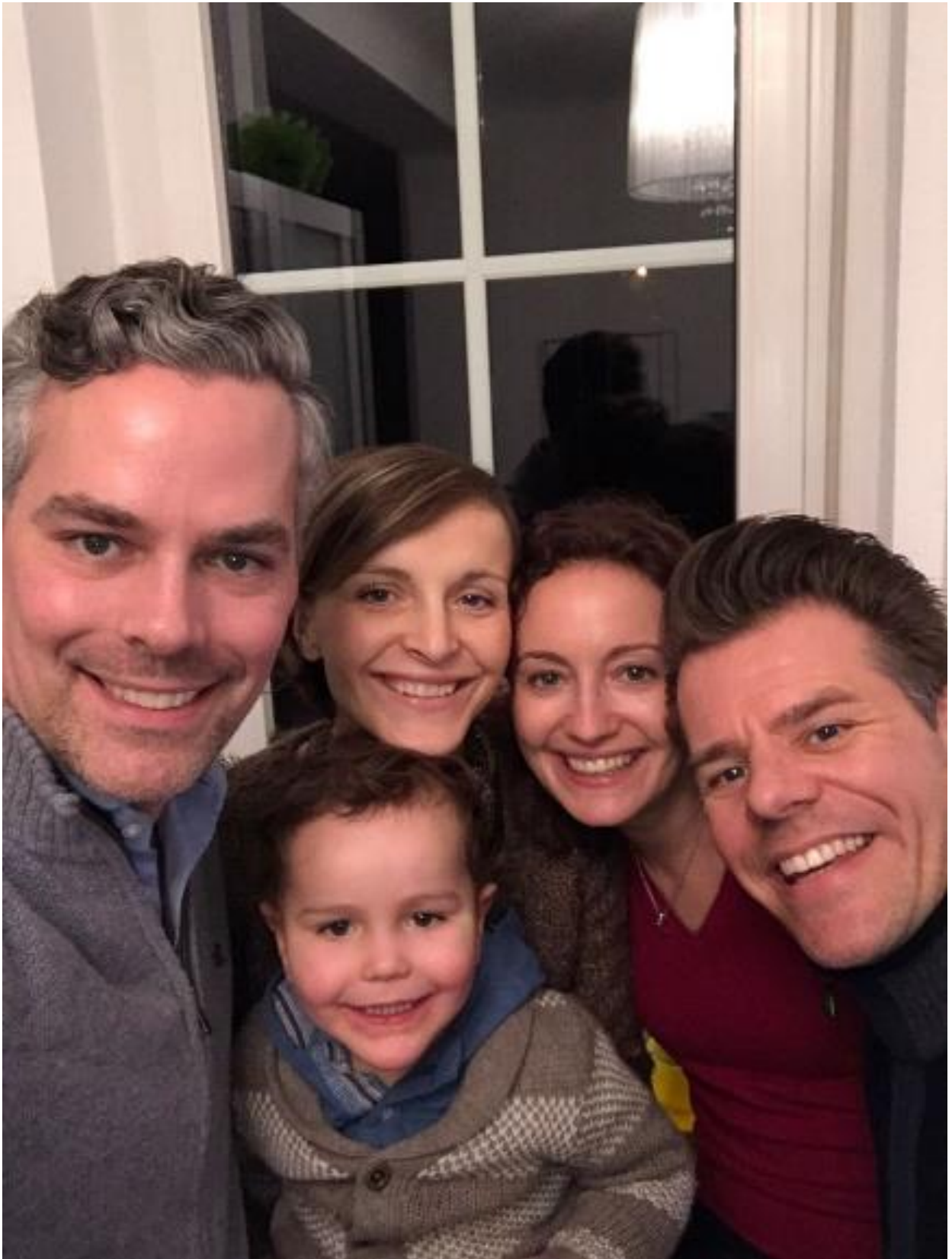
Die neue Familie Buhr / Munterer / Fleischfresser