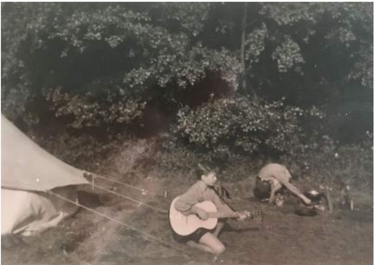
Im Zeltlager Gitarre mit den Pfandfinder gelernt