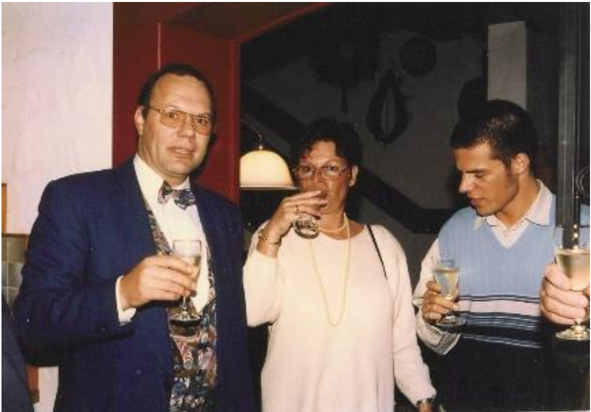
Schon wieder Essen und Trinken