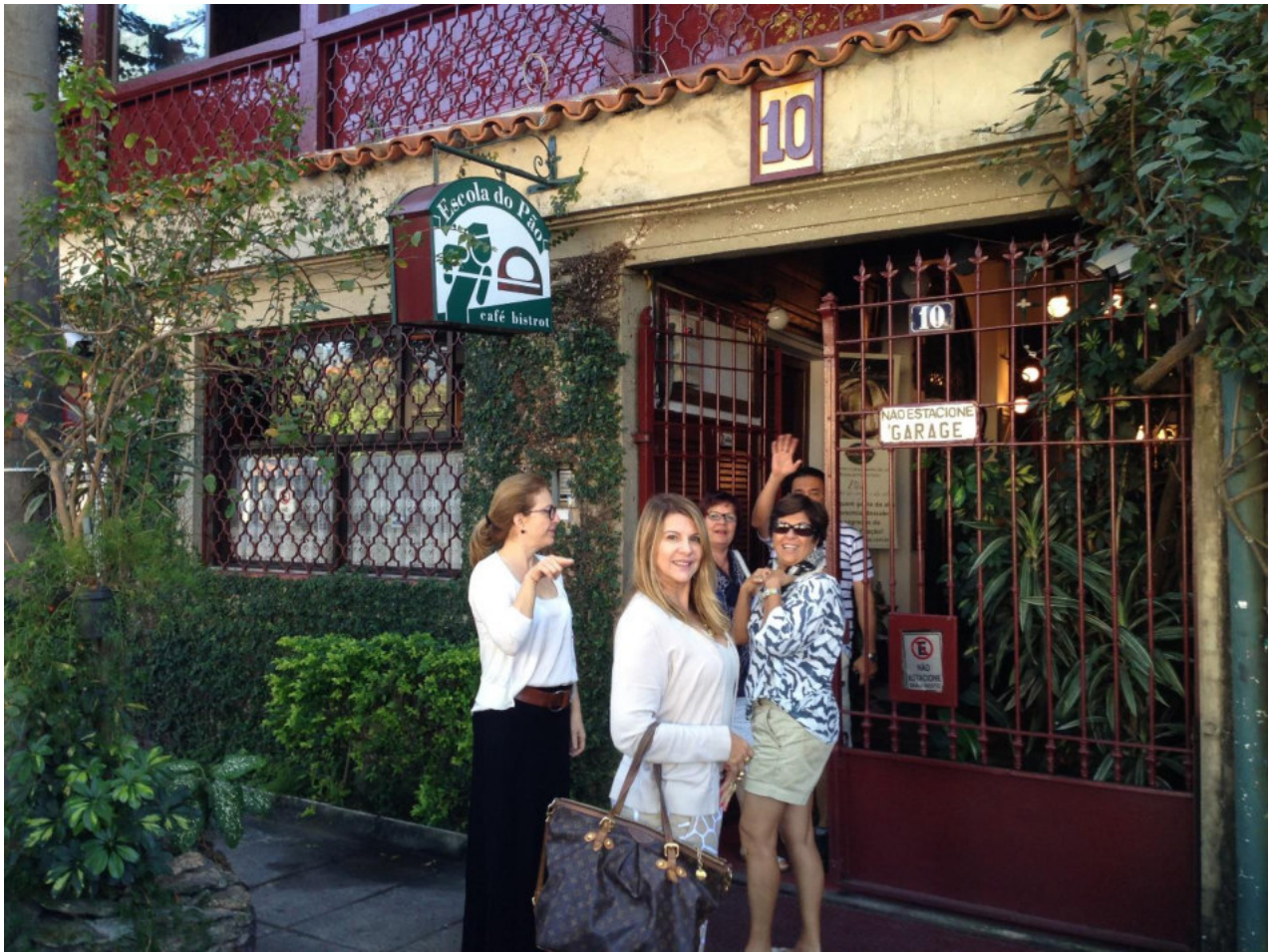
Weit weg von Rio fast im Regenwald