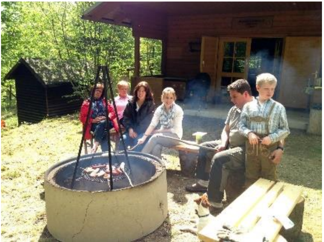
Vor und in der Jagdhütte Montabaur – Bad Ems