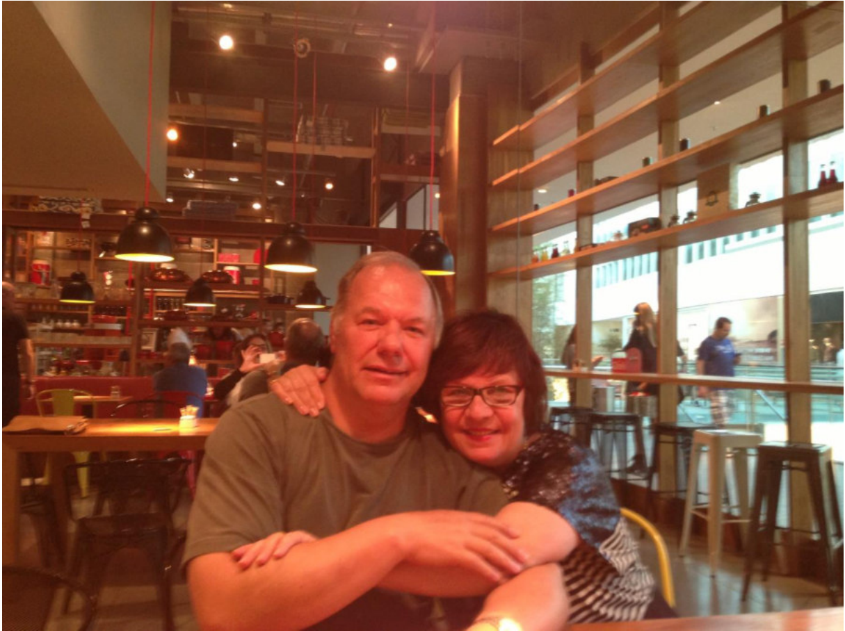
Zurück in der Zivilisation