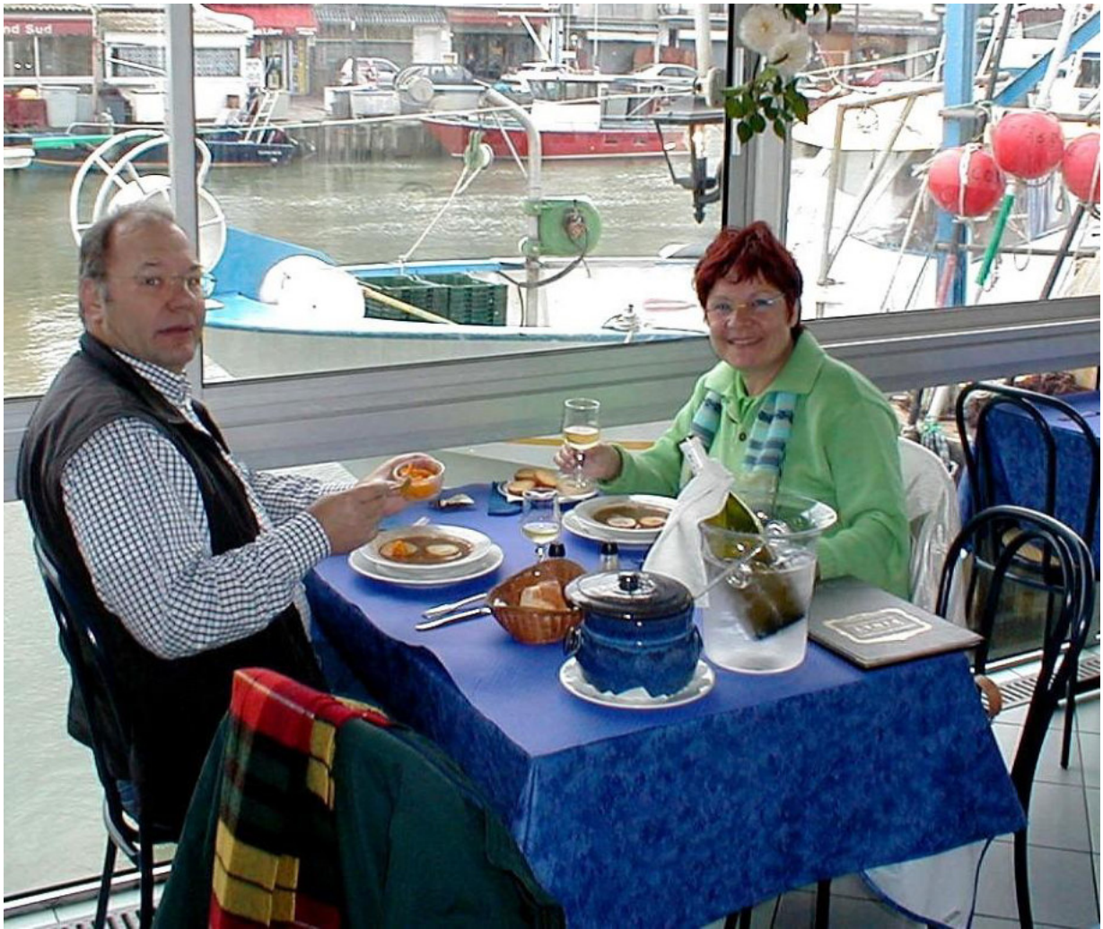
Le Grau du Roi