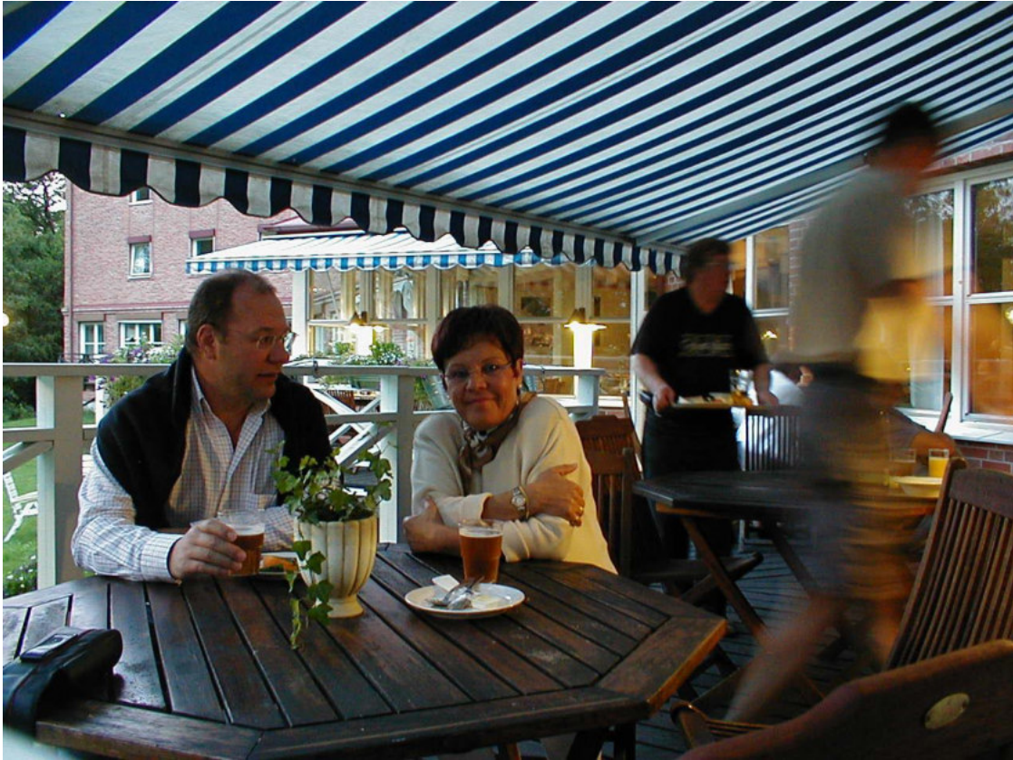
Midsommer in Öchslesund