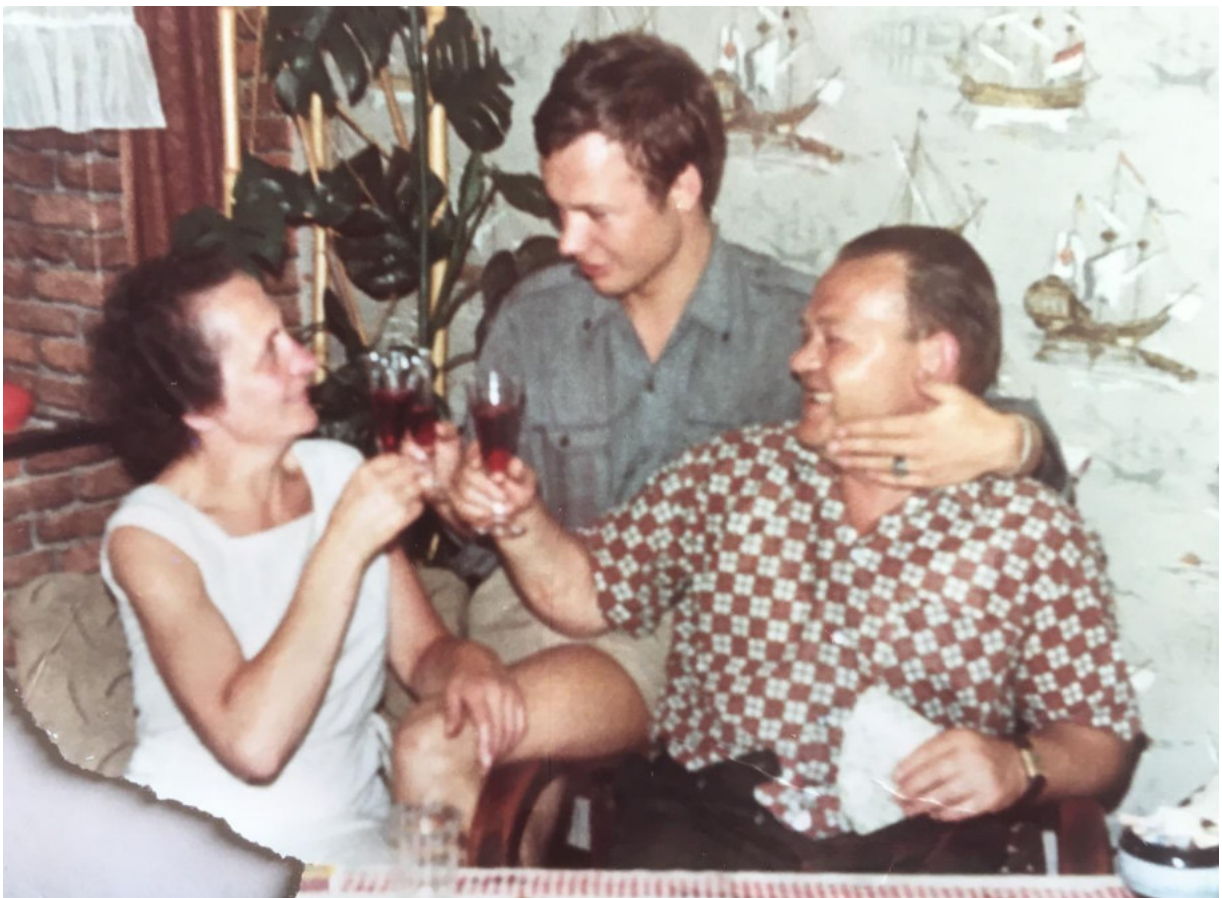
Ich mit meine Eltern in der Schulstrasse Nr. 3 Ebernhahn