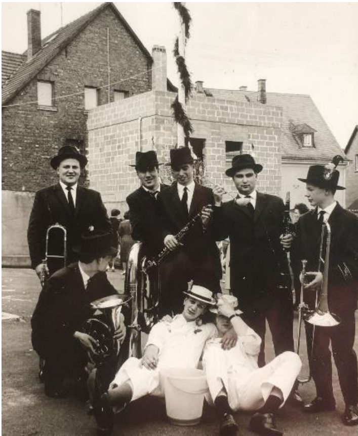
Kirmes 1964 in Ebernhahn