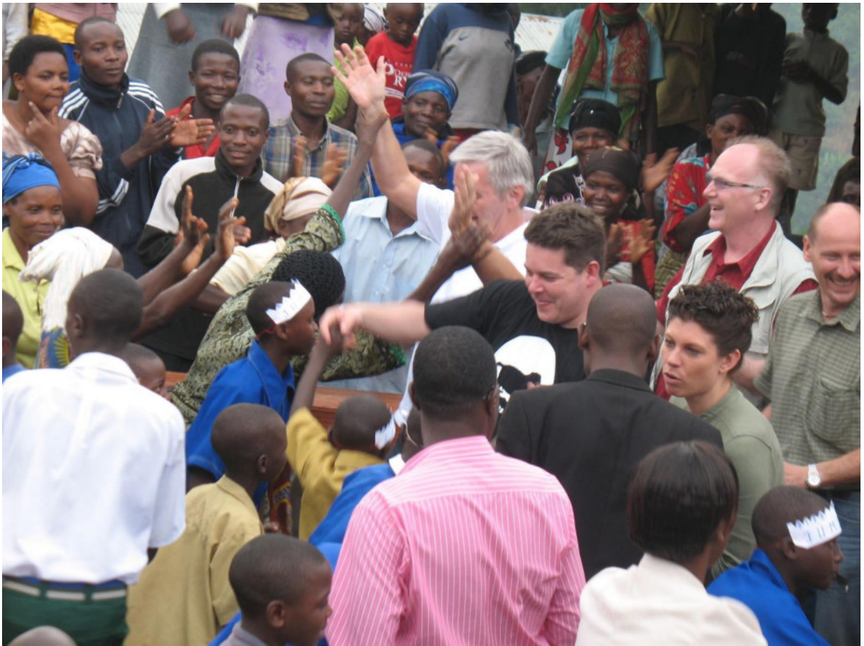
Wieder in Brasilien