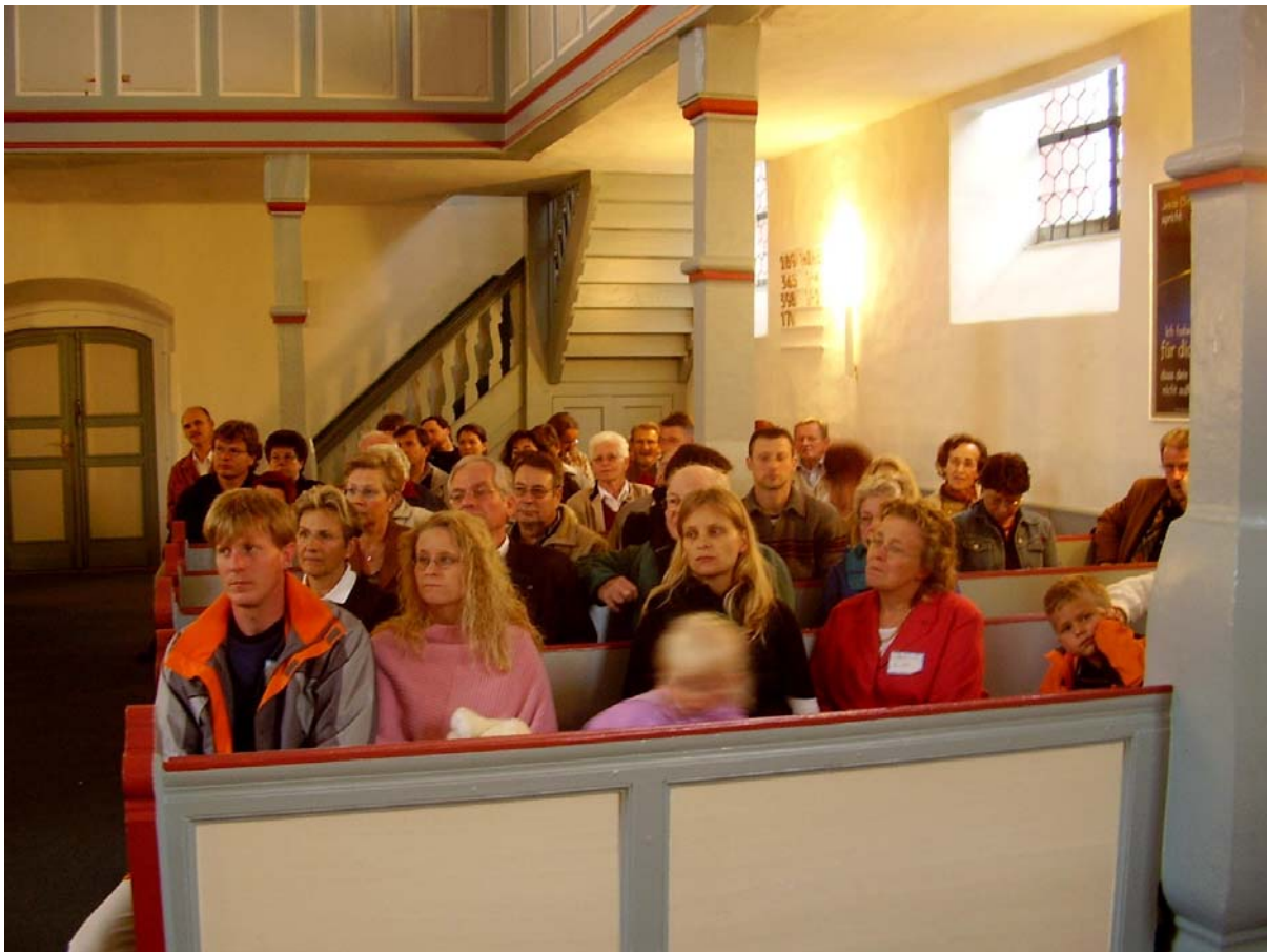
Zweite Bank von vorn links zum Altar war die Stammbank der Fam. Kröck seit 1733