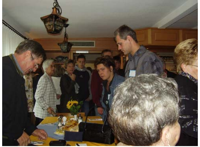
In der evg. Pfarrkirche