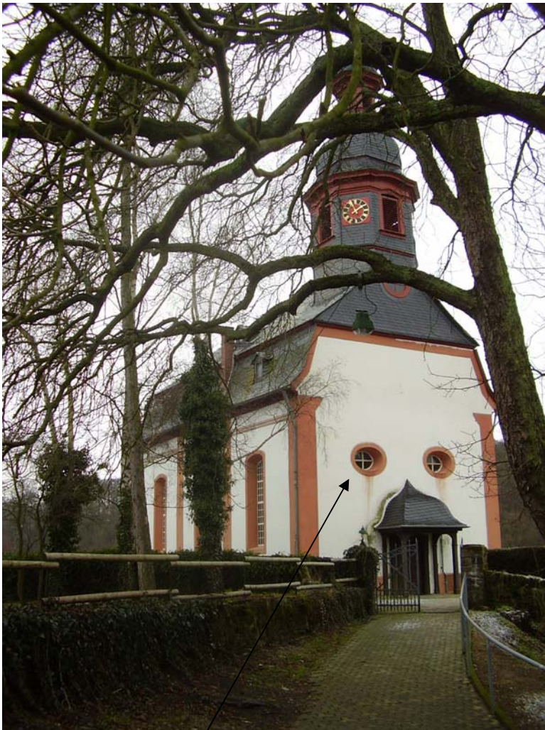
Church of Untermeilingen 2006

mean difference 2 windows and nice painted watch