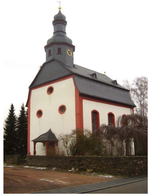
Church at Holzhausen - Heide 2006, similar like Church below